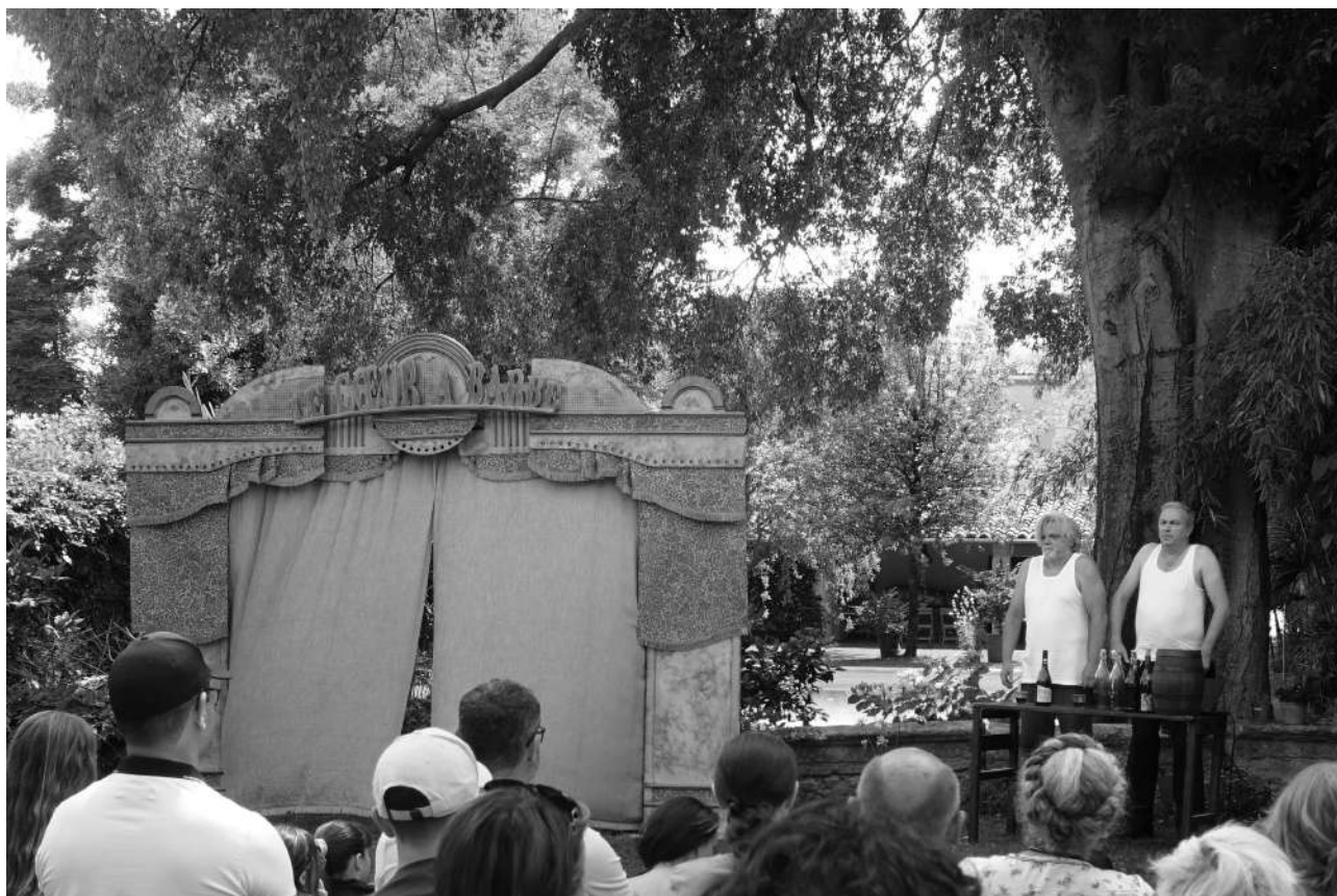
Les Rois de la Lutte version courte, Festival Lez'Arts Mouvants 2025, Saint André de Sangonis, Montpellier