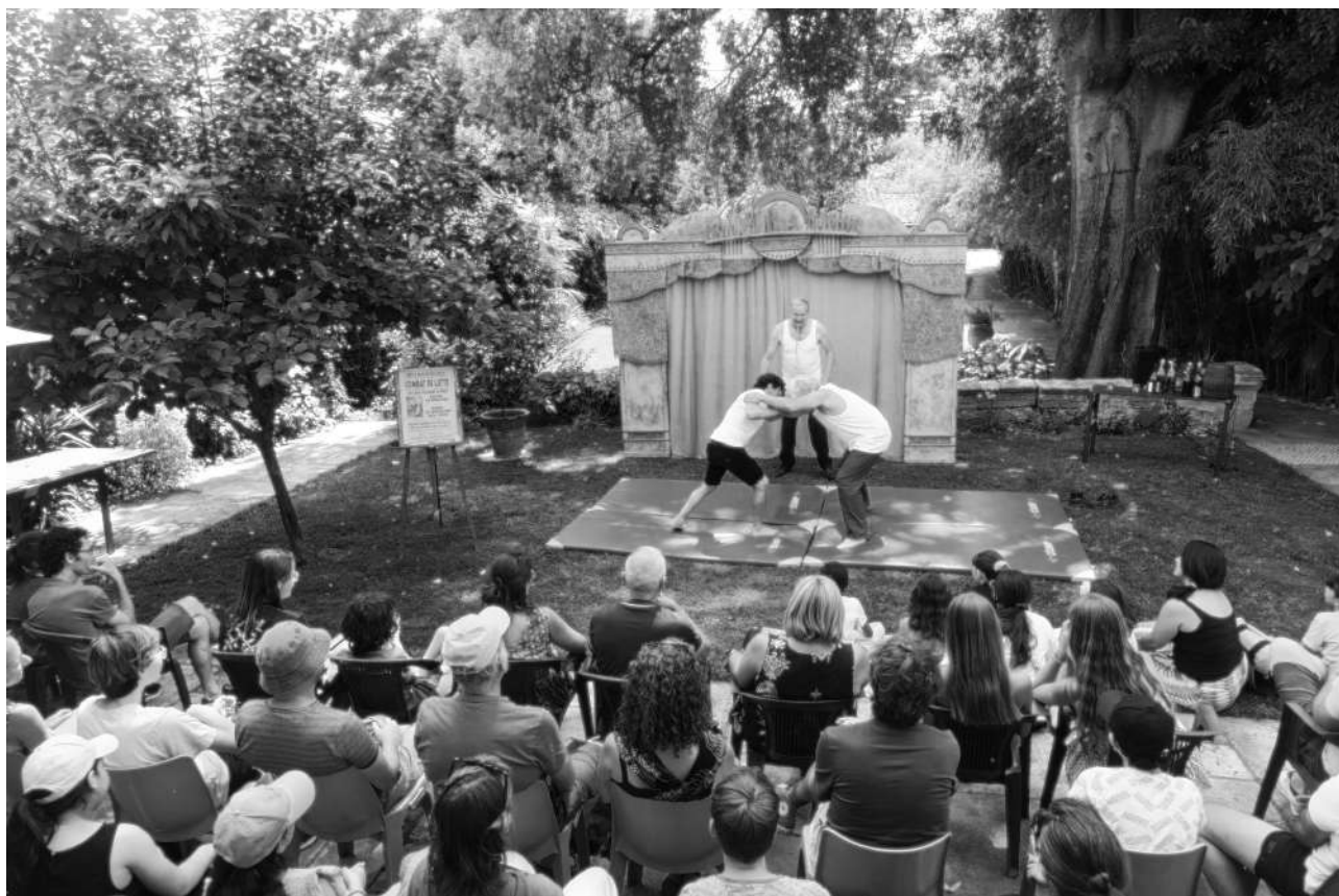
Les Rois de la Lutte version courte, Festival Lez'Arts Mouvants 2025, Saint André de Sangonis, Montpellier