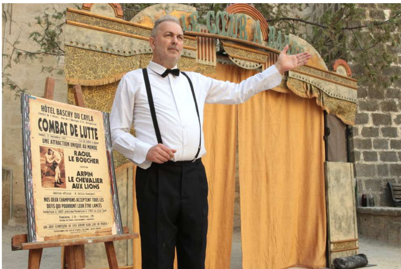
Les Rois de la Lutte version courte, Journées du patrimoine 2023, Hôtel Baschy du Cayla, Montpellier